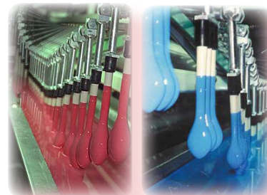
รูปที่ 2 ตัวอย่างการจุ่มแม่พิมพ์ลงในน้ำยาง