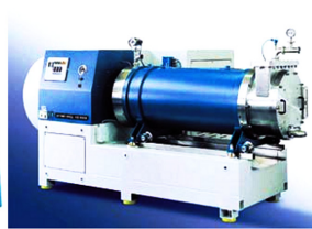
(ค) Horizontal mill