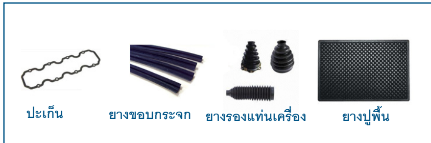
รูปที่ 1 ตัวอย่างชิ้นส่วนยางต่างๆ ที่ใช้ในรถยนต์

ชิ้นส่วนยางที่ใช้ในรถยนต์นอกจากยางล้อ ท่อยาง และสายพานแล้วยังมีอีกมากมายหลายชิ้น เช่น ปะเก็น (gasket) ยางขอบกระจก (windshield weatherstrip) ยางรองแท่นเครื่อง (mount engine) ยางปูพื้น (rubber mat) เป็นต้น โดยมีกระบวนการผลิตแสดงดังรูปที่ 2